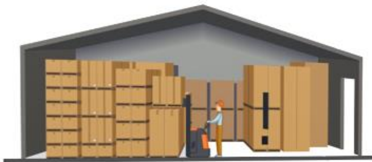
— Inventory —

การบริหารสินค้าคงคลังมีต้นทุนที่เกี่ยวข้อง แบ่งได้เป็น 4 ประเภทหลัก ดังนี้